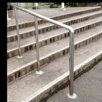
駅手摺〈鹿児島県始良市〉