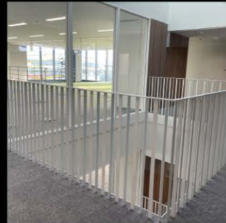
オフィスビル手摺〈鹿児島市〉