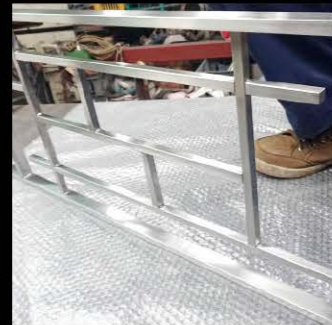
ホテル装飾〈鹿児島市〉