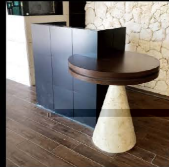
ホテルカウンター〈沖縄県〉