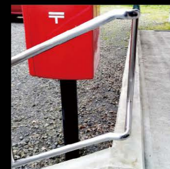
階段手摺〈鹿児島県始良市〉